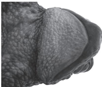
Рис. 4. Серая жаба с кривой верхней челюстью

«Калужские засеки» данная аномалия отмечалась только в одном – широколиственном – лесу.