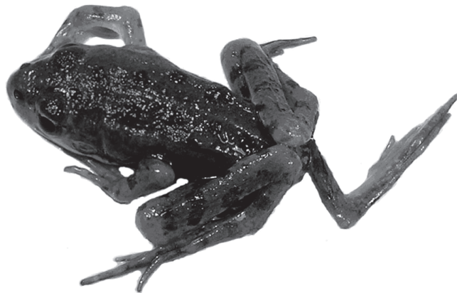
Рис. 1. Сеголеток озерной лягушки с полимелией

Полимелия ( Polymelia ) отмечена в августе 2008 г. в Калуге, микрорайон Турынинские Дворики, в пруду у сеголетки озерной лягушки – Pelophylax ridibundus (Pallas, 1771). Выражена развитием дополнительной задней ноги (рис.1). По Волжскому бассейну известны единичные находки [Файзулин, 2011; Замалетдинов, 2003; Borkin, Pikulik, 1986].